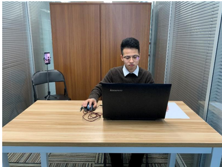
图一：电脑端正面视角

(1) 考生需于每场考试开始前 30 分钟，登录移动端“智考通”，用前置摄像头 360 度环绕拍摄考试环境，随后将移动设备固定在能够拍摄到考生桌面、考生电脑屏幕内容、周围环境及考生行为的位置上继续拍摄（详见说明书中《智考通操作手册》《智考云在线考试规范》）。