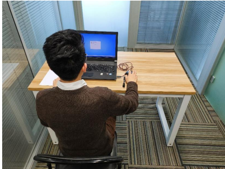
图二：电脑端背面视角